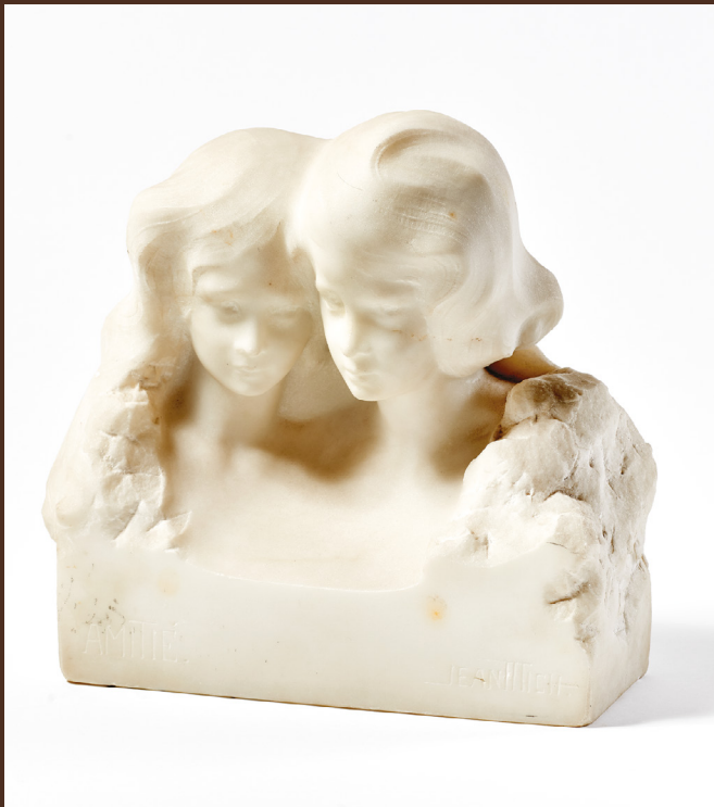
| Freundschaft, Marmorskulptur von Jean Mich, um 1900 – MNAHA