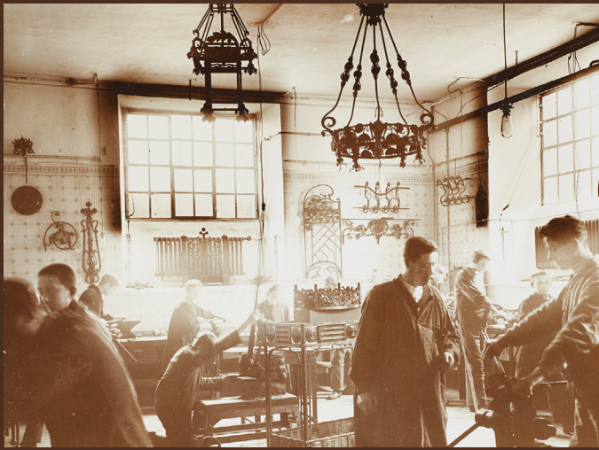
| Fotografie des Kunstschmiedeateliers in der Handwierschoul, um 1900 – Sammlung M. Galowich