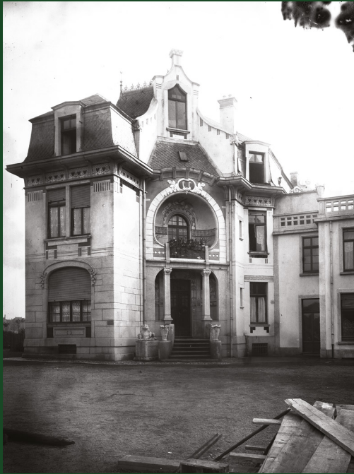
| Fotografie der Villa Clivio, aufgenommen von dem Architekten Mathias Martin, 1908 – Sammlung J.-P. Martin