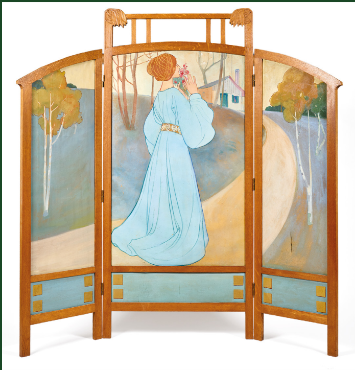
| Jugendstilparavent, entworfen und realisiert von Dominique und Pierre Lang, Öl auf Leinwand und Eiche, um 1900 - Privatsammlung