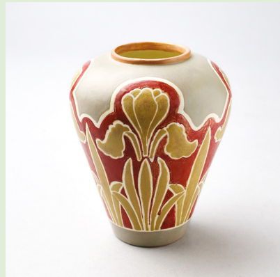
| Vase, entworfen und handgemalt von Antoine Jans, aus Steingut hergestellt von Villeroy & Boch, Septfontaines-lez-Luxembourg, Salonausstellung des CAL 1914 – MNAHA, Schenkung M.-J. Nilles