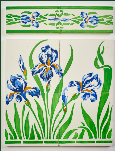
Fliesen für einen Wandfries, aus Steingut hergestellt von Villeroy & Boch, Septfontaines-Luxembourg, um 1900 – Sammlung G. Freimann, Luxemburg